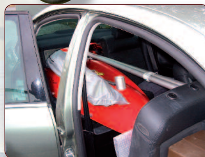
Transport sur galerie ou dans votre voiture