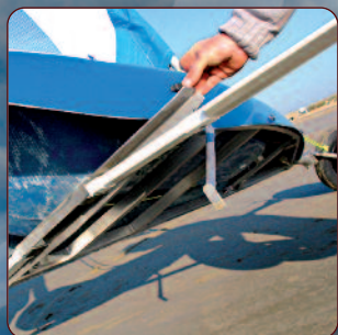
Châssis inox ceinturant la coque Essieux vite montés/démontés

INITIATION OU PERFECTIONNEMENT, LE MC2 EST IDÉAL.