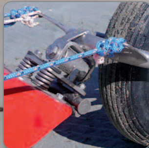
Suspension avant à ressorts