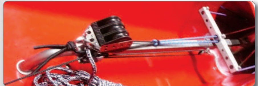
Palonnier réglable à votre taille, même en roulant (petit cordage au taquet le long du rail), et Rail télescopique (2 positions) permettant d'avancer le pouliage : le confort pour tous en position allongée.