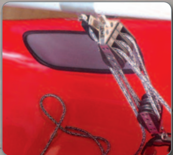
Ouïes latérales obturées par du tissu lycra (aisance au niveau des coudes en position allongée)

POUR UN CLUB OU UN PARTICULIER LE MAXXL S'AVÈRE "L'OUTIL" IDÉAL POUR DISPENSER UNE FORMATION COMPLÈTE OU PROGRESSER À SON RYTHME. NÉ D'UNE RÉFLEXION GLOBALE ET LONGUE IL NOUS SEMBLAIT CLAIR CHEZ SEAGULL, DESIGNER DE CHARS À VOILE, QU'UN PILOTE DÉBUTANT MAÎTRISERA DE MIEUX EN MIEUX SA MACHINE, LE MAXXL PERMETTRA DE COMMENCER À ÉVOLUER EN POSITION ASSISE, PUIS SEMI-ALLONGÉE, ET ENFIN D'ABORDER UNE POSITION COUCHÉE COMME EN COMPÉTITION.